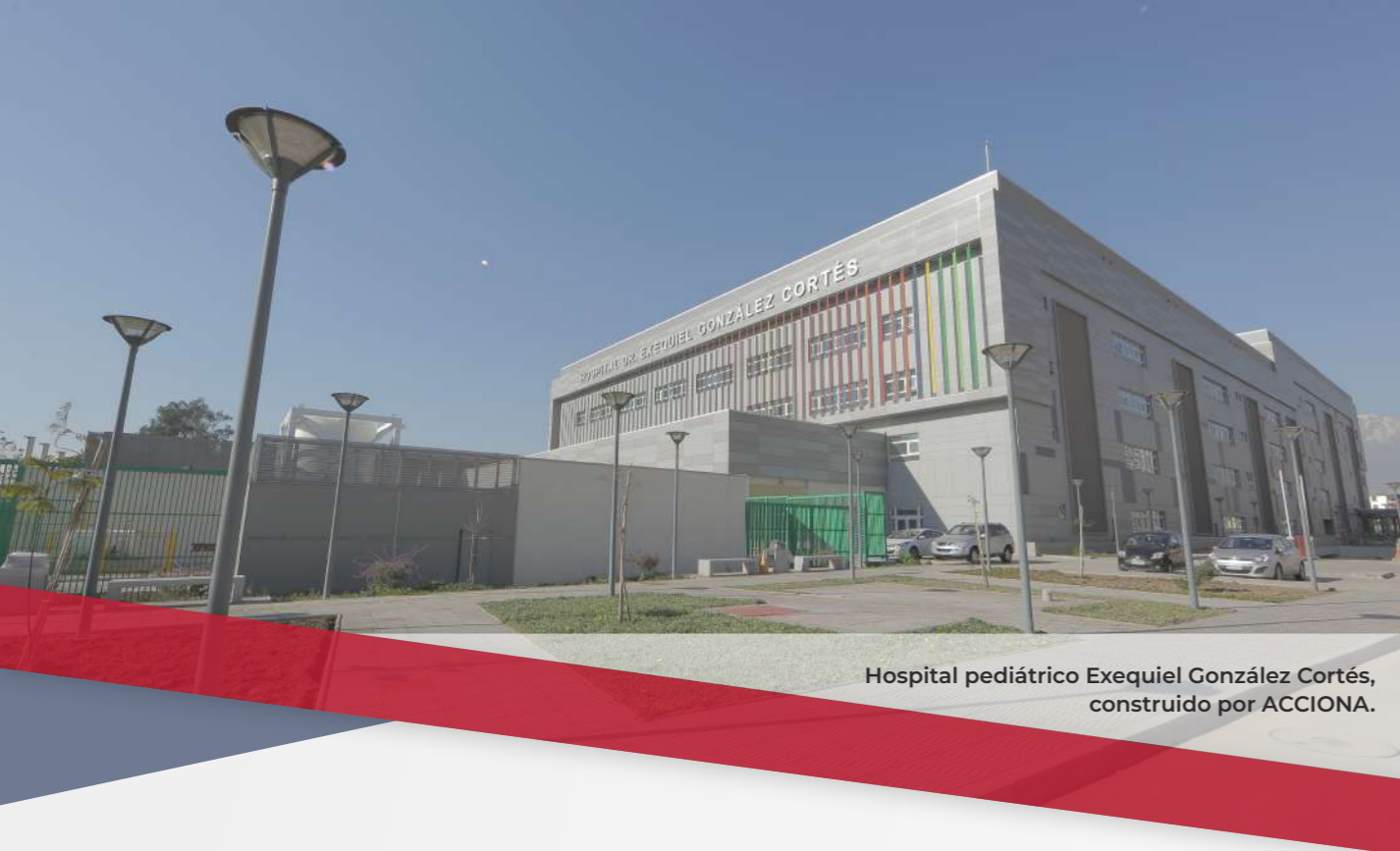
Hospital pediátrico Exequiel González Cortés, construido por ACCIONA.