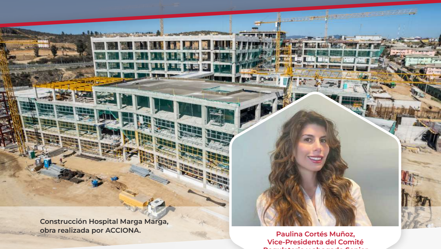
Construcción Hospital Marga Marga, obra realizada por ACCIONA.