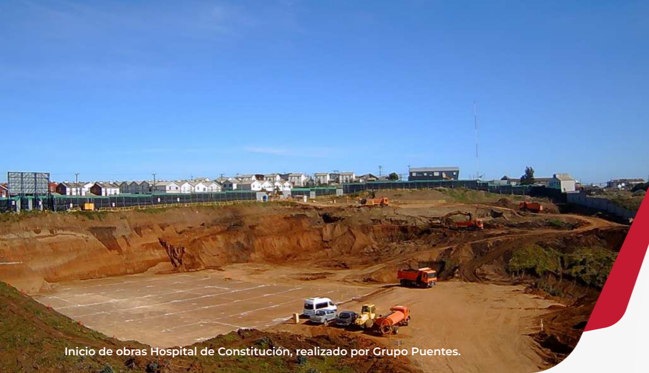
Inicio de obras Hospital de Constitución, realizado por Grupo Puentes.