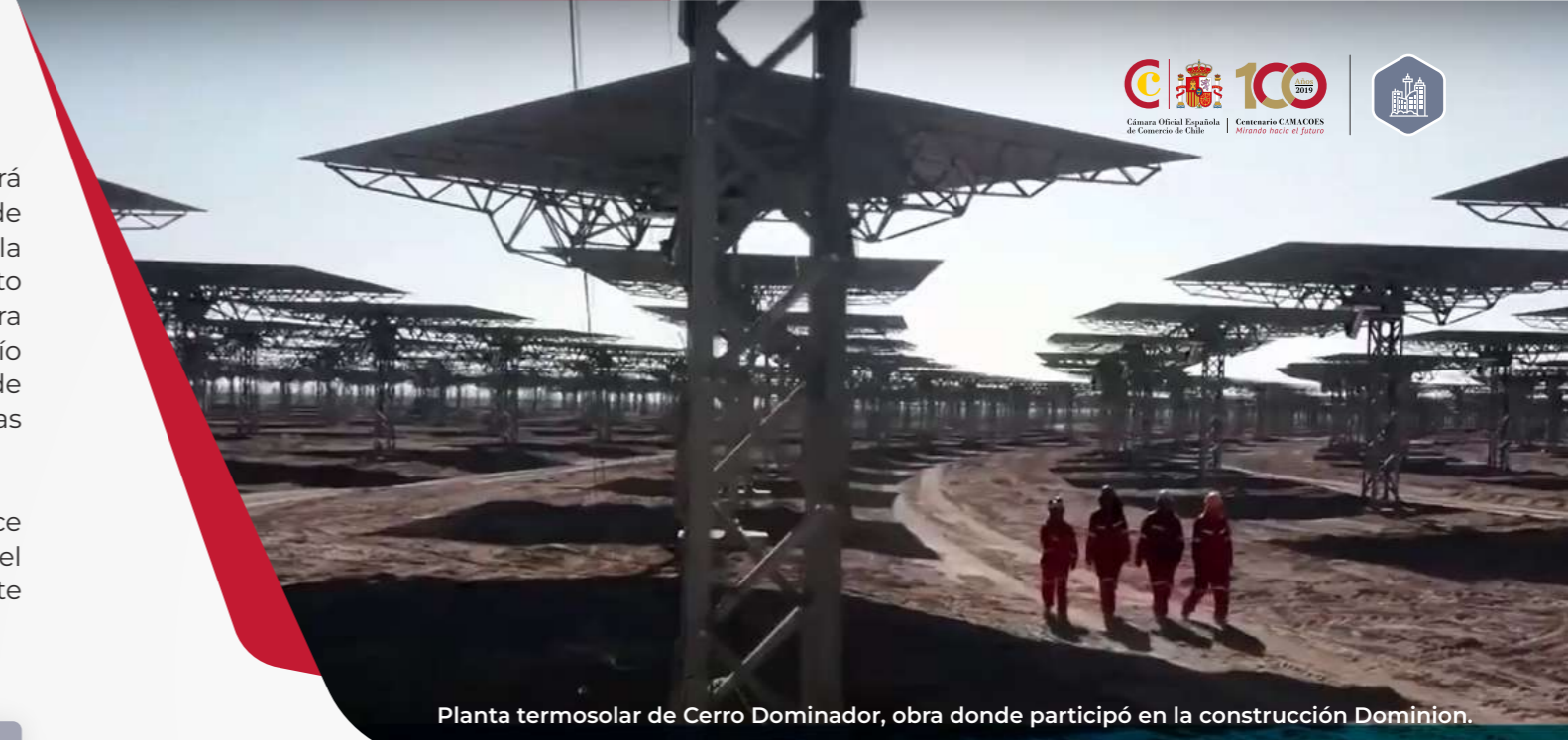
Planta termosolar de Cerro Dominador, obra donde participó en la construcción Dominion.

Sin duda somos una empresa que conoce bien el mercado de infraestructuras del país, el cual está en constante crecimiento”.