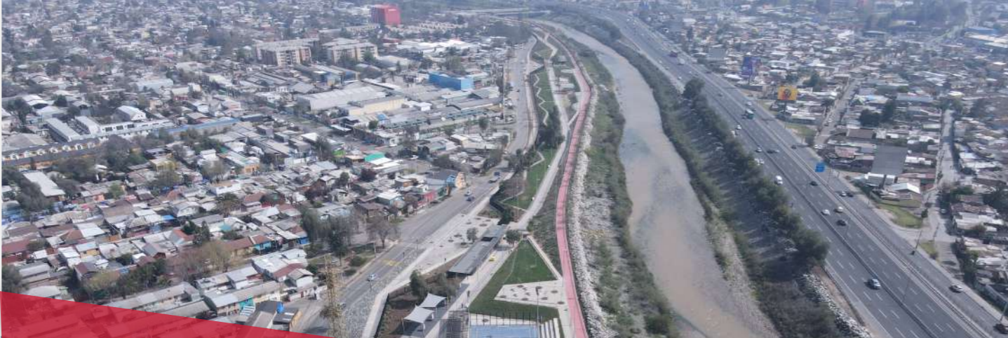
Mapocho Río es una obra construida por FCC Construcción.